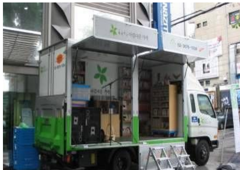
판매 시스템 (매장, 이동매장, 인터넷)