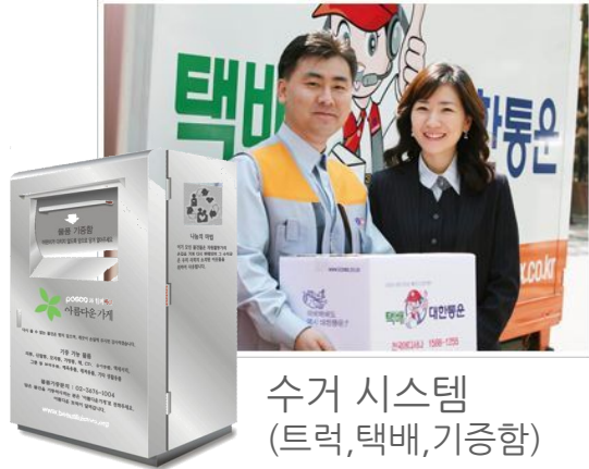
수거 시스템 (트럭,택배,기증함) 1577-1113